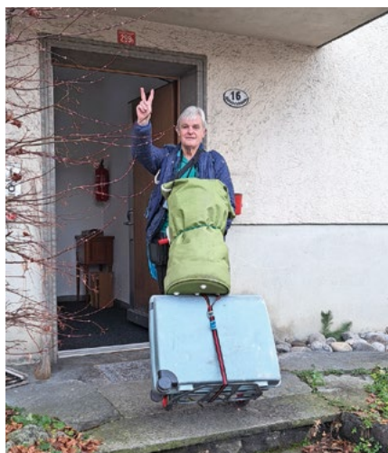
Der Reiseleiter vor seiner «home base».

Und genau das macht die Lodge 6102 zu dem, was sie ist: ein Haus voller Zimmer – und voller Geschichten ...»