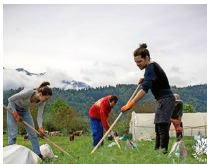
«Solawi» auf dem Fluckhof.

Auf dem idyllischen Fluckhof auf dem Littauer Berg, nicht weit von Luzern, produzieren die 80 Mitglieder der solidarischen Landwirtschaft (Solawi) Randebandi frisches Bio-Gemüse für den Eigengebrauch. Sie werden angeleitet von zwei professionellen Gärtnerinnen. Die Randebandi ist ein grosser, professionell geführter Gemeinschaftsgarten.