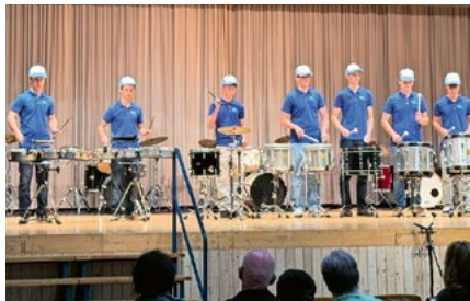
Bühne frei für die Ensembles.

In Schachen findet das Spektakel in der Mehrzweckhalle statt. Von 8.45 bis 17.00 Uhr gibt es Musik nonstop – begleitet von einem kleinen Beizli der Oberstufenklasse aus Malters von Sabi-