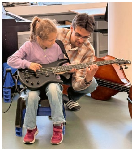
Der E-Bass begeisterte ...

Nicht zuletzt erfreute sich auch die Festwirtschaft grosser Beliebtheit: Rund 300 Würste und 100 Hotdogs wurden verkauft. Mit seinem abwechslungsreichen Programm, dem grossartigen Engagement aller Beteiligten und dem perfekten Wetter bleibt das Instrumentenfest als rundum gelungener Anlass in bester Erinnerung. (jr)