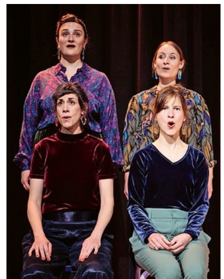
FAMM in Action.