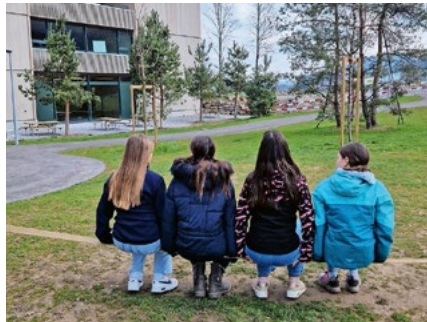
Den Mittag in Gemeinschaft verbringen, wie hier am Mittagstisch im Muoshof.

Das gefragteste Element ist bereits seit Jahren der sogenannte Mittagstisch (E2).