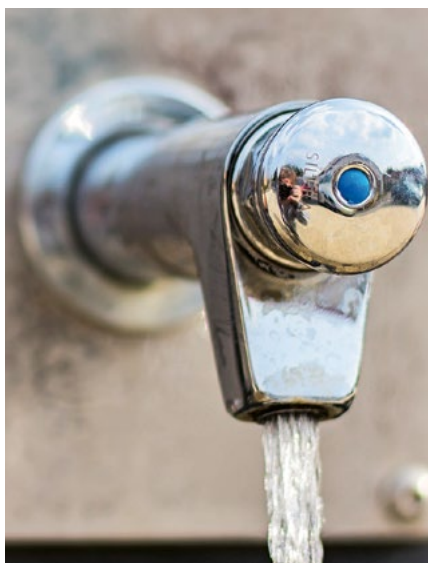
Direkt ab Hahn geniessbar: Malterser Trinkwasser ist von sehr guter Qualität.

6521 Einwohner wurden mit Trinkwasser von der Wasserversorgung Malters beliefert. Die gesamte verbrauchte Wassermenge betrug 410 373 m 3 und stieg gegenüber dem Vorjahr um 1,8 %. Der durchschnittliche Verbrauch pro Ein-