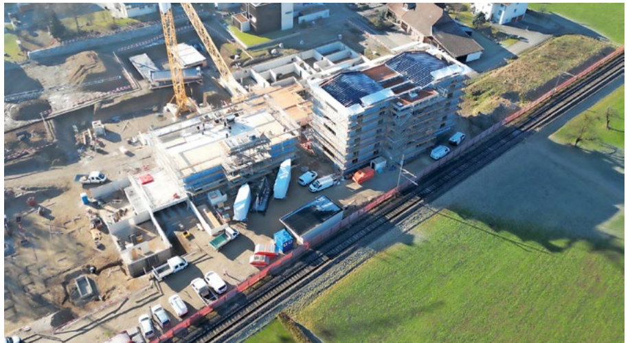
Es ist viel los auf der Baustelle Dangelbachmatte.

Wer sich selbst ein Bild vom Baufortschritt machen möchte, ist herzlich eingeladen zum Tag der offenen Baustelle (siehe Kasten) . Interessierte Personen erhalten dabei die Gelegenheit, bei Baustellenführungen einen direkten