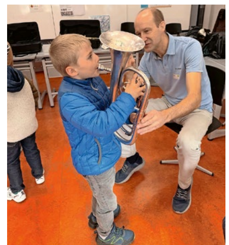
... und auch das Es-Horn fand Anklang.