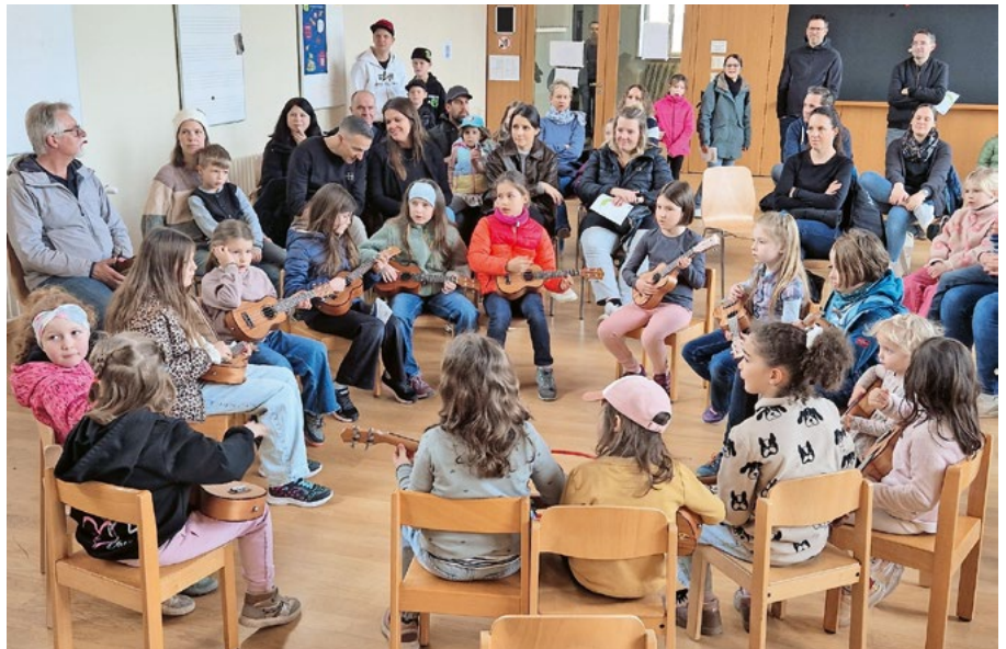
Der Workshop Ukulele war gut besucht.

Mit seinem abwechslungsreichen Programm, dem grossartigen Engagement aller Beteiligten und dem perfekten Wetter bleibt das Instrumentenfest als rundum gelungener Anlass in bester Erinnerung.