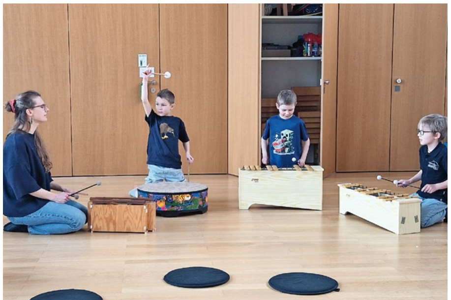
Jungs beim Erleben des Rhythmus.