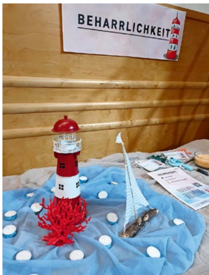
Welche Wirkung hat Beharrlichkeit?

Im Anschluss an das Podium hatten die Gäste die Möglichkeit, verschiedene Marktstände zu besuchen. Diese wurden von Lehrpersonen betreut und boten einen Einblick in die Werkzeuge der «Neuen Autorität». Anschaulich wurden zentrale Elemente wie Präsenz, Beharrlichkeit oder Werkzeuge vorgestellt. Die Besucherinnen und Besucher konnten Fragen stellen, Beispiele diskutieren und konkrete Anregungen für den Alltag